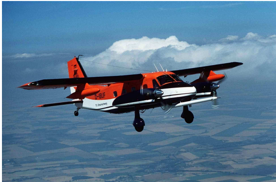
Die DO 128-6 D-IBUF des Instituts für Flugführung der TU Braunschweig.

Die DO 128-6 D-IBUF der TU Braunschweig ist standardmäßig mit einer Vielzahl vor allem meteorologischer Messgeräte ausgerüstet. Das IMK setzt die DO 128 regelmäßig in Messkampagnen ein und stattet sie hierfür mit weiteren Messgeräten aus.