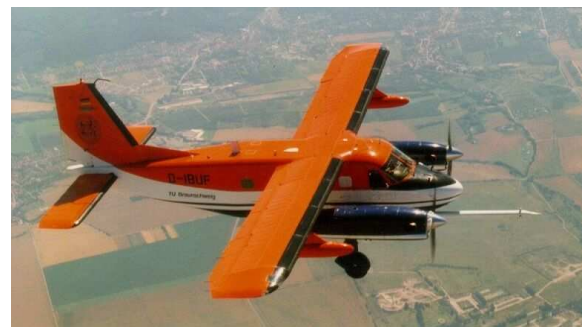
Die Dornier D-IBUF der TU Braunschweig.

Das vom IMK in Zusammenarbeit mit der Firma Enviscope entwickelte „Chemiemodul“ in der D-IBUF (oben) mit Übersicht der Messgrößen und den dazugehörigen Messverfahren (unten).